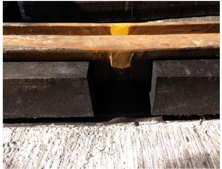
Schienenschweißstoß vor dem Vergießen mit e)(s PurFlex