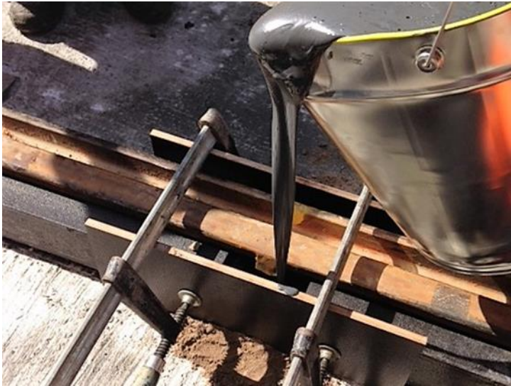
Schienenschweißstoß beim Vergießen mit e)(s PurFlex