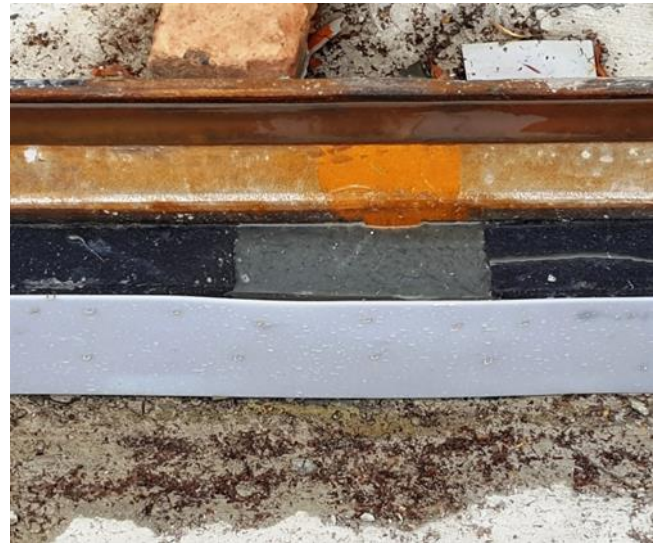
Schienenschweißstoß mit e)(s PurFlex